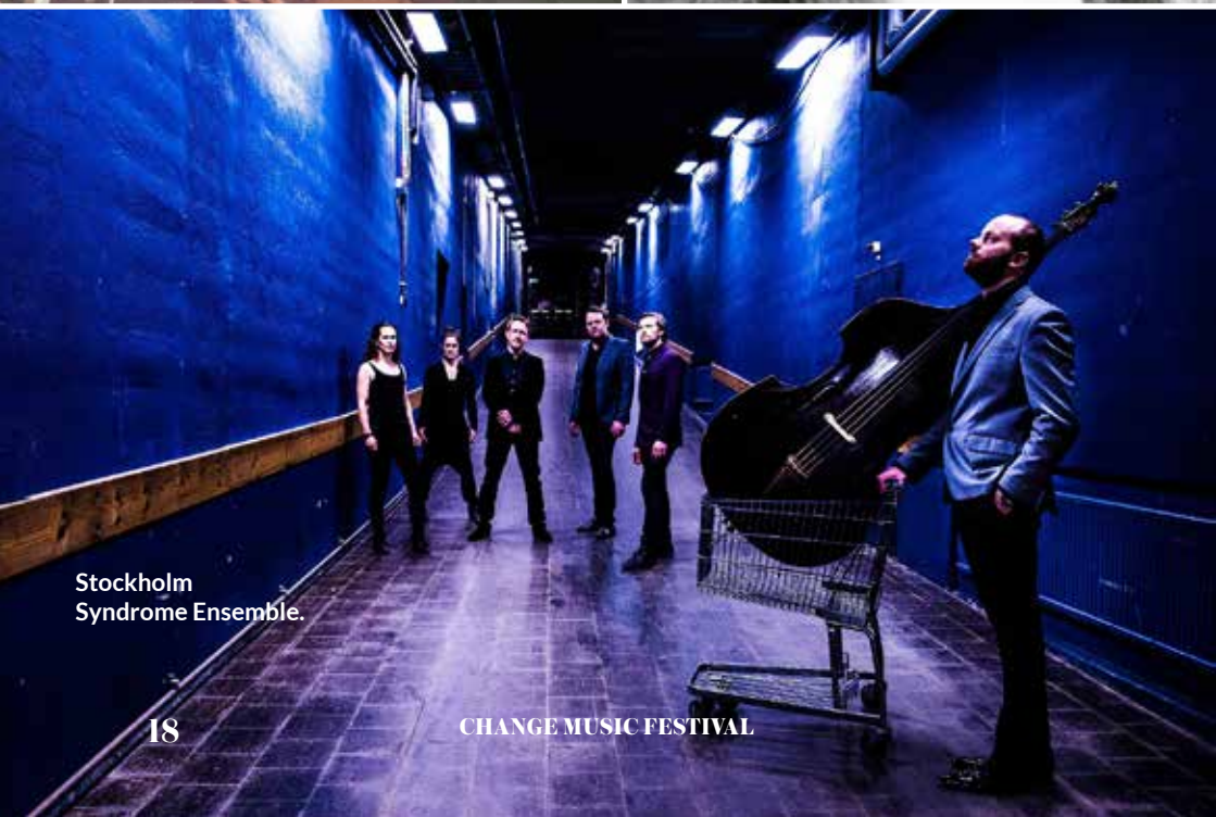
Stockholm Syndrome Ensemble.